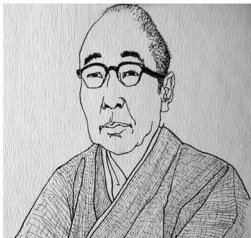
江戸川乱歩 Edogawa Ranpo (1894—1965)