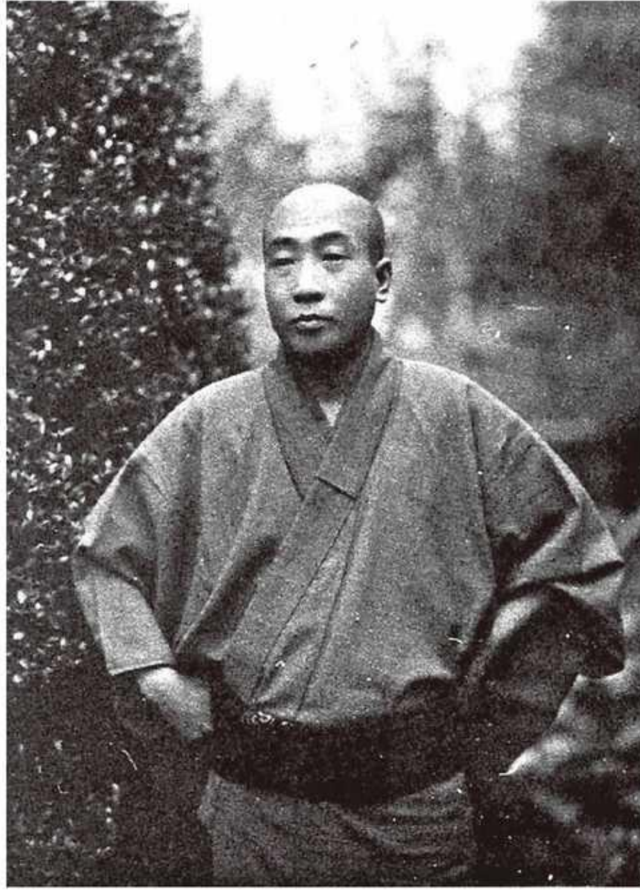
摄于一九三六年自家庭院，彼时正式迈入少年读物的时代。