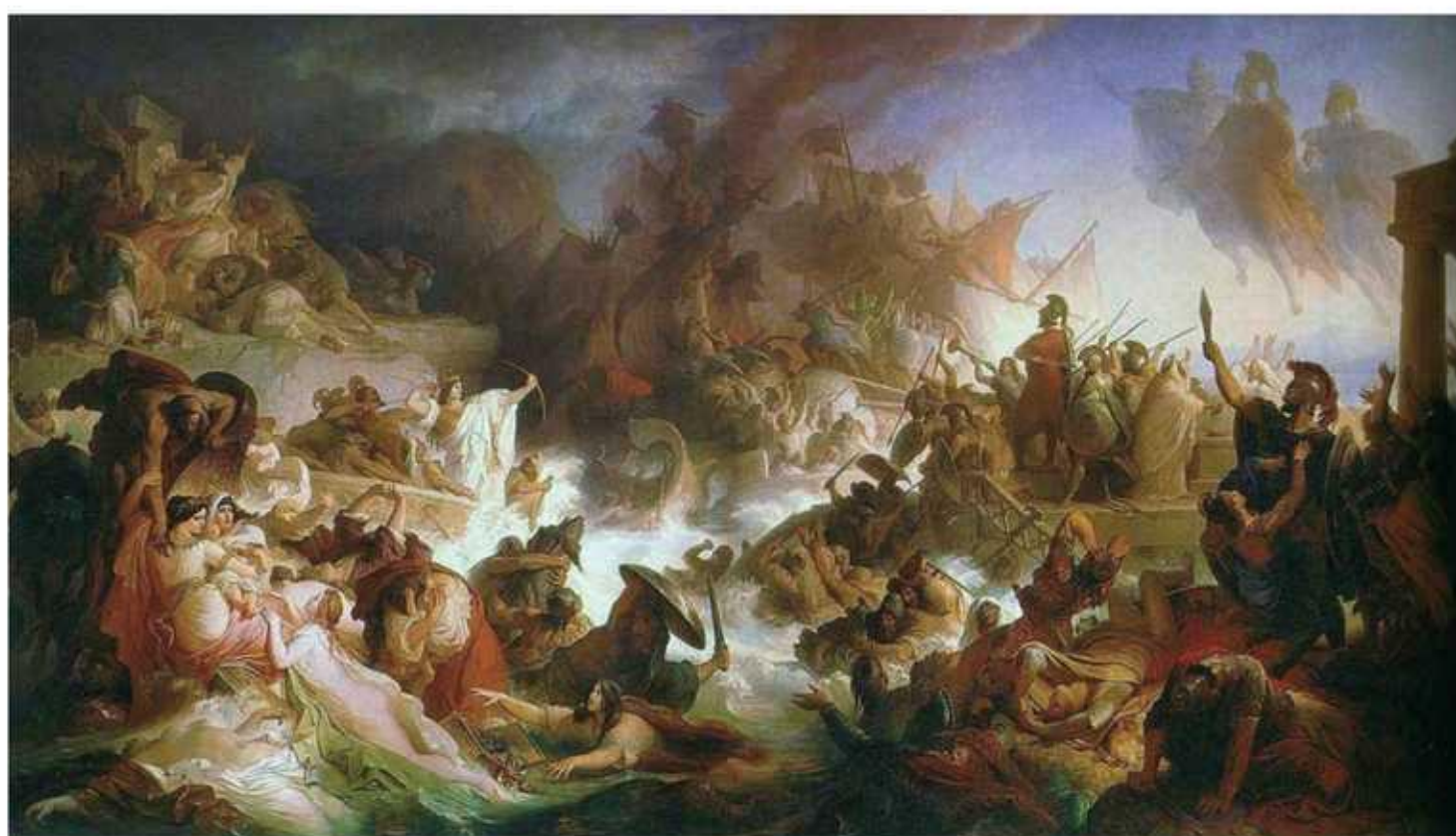
威廉·冯·考尔巴赫：《萨拉米斯海战》，1868年。萨拉米斯海战是欧洲历史上的第一次大规模海战，希腊人的最终胜利同时决定了自己和欧洲的未来命运。

西布莉与乐师雕像，公元前6世纪中叶。西布莉是掌管丰饶的地母神。在希腊人和波斯人第一次发生冲突时，希腊人摧毁了一座西布莉的神庙，这激怒了波斯国王大流士，他发誓要向希腊人复仇。