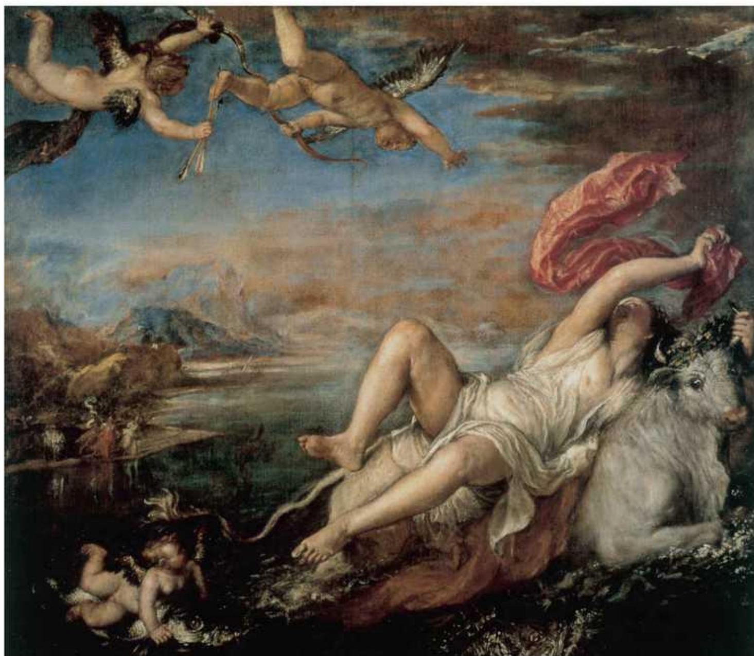
提香·韦切利奥：《劫掠欧罗巴》，1562年。这幅画表现的诱拐欧罗巴的故事，很长时间内一直是欧洲民族和“西方”的起源神话。